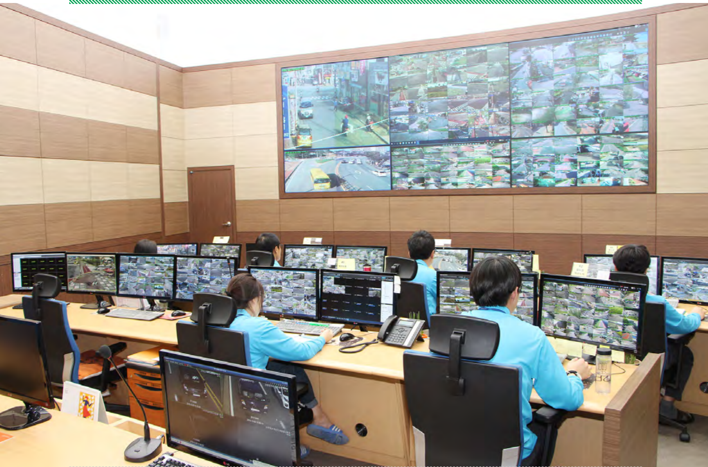
스마트도시 통합운영센터 CCTV관제센터 업무 장면 |