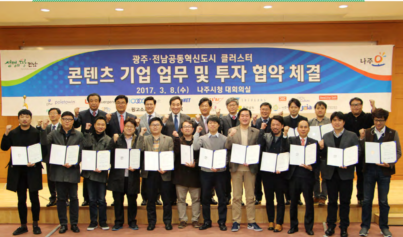
혁신도시클러스터 콘텐츠기업 투자협약식 |