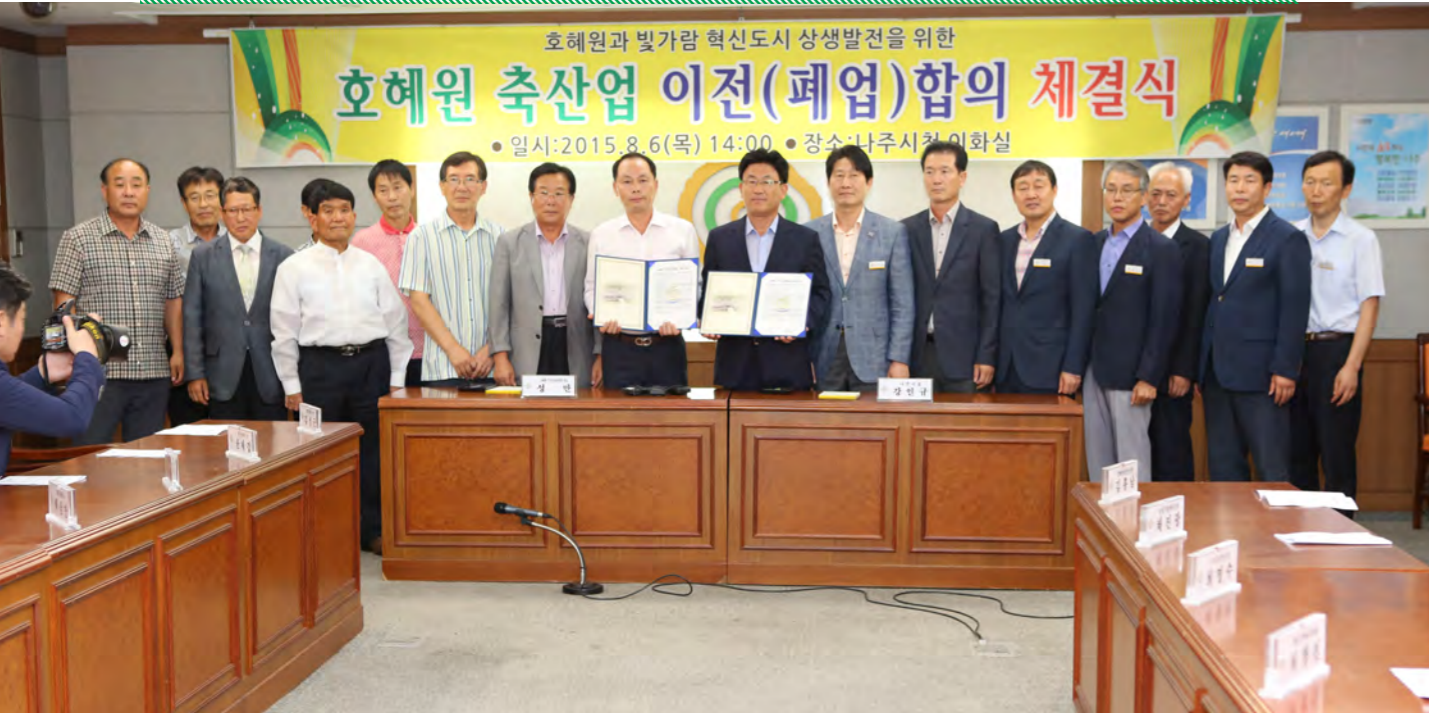
호혜원 축산업 이전(폐업)합의 체결식 |