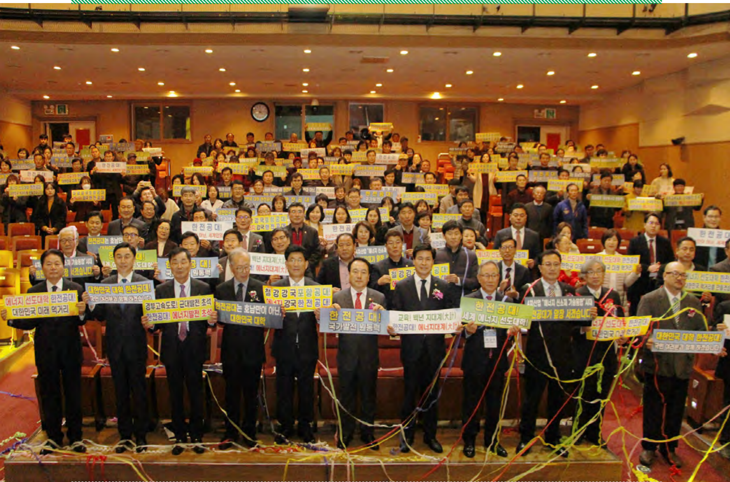
한전공대 설립 범나주시민 지원위원회 출범식 |