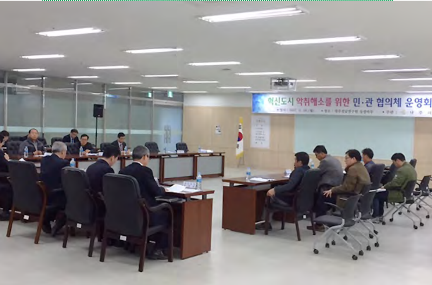
혁신도시 약취해결위한 민·관협의체 회의 |