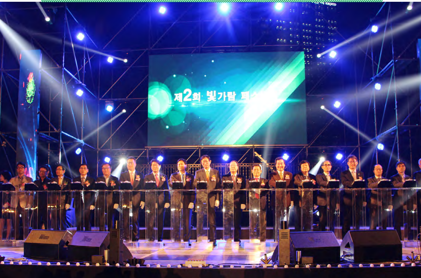
빛가람페스티벌 개막식 |